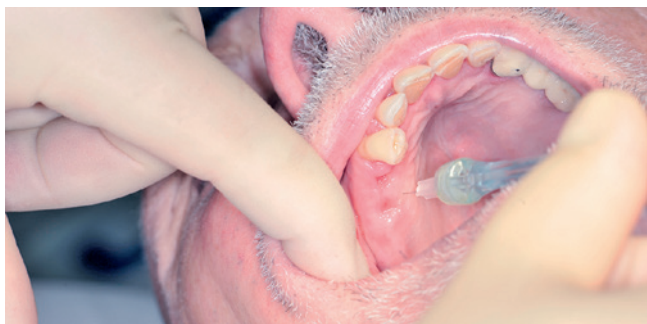
Abb. 4: Die Kanülenspitze wird in Höhe des Kieferkammes in die Gingiva eingeführt, bis ein Kontakt mit dem Knochengewebe spürbar wird. Im Einstichgebiet – fast auf Kieferkammmitte – wird ein großes Areal anämisch.

Die bei der Installation des STA-Systems aufgestellte Hypothese, dass es mittels intraligamentärer Injektionen auch im Bereich der ge-