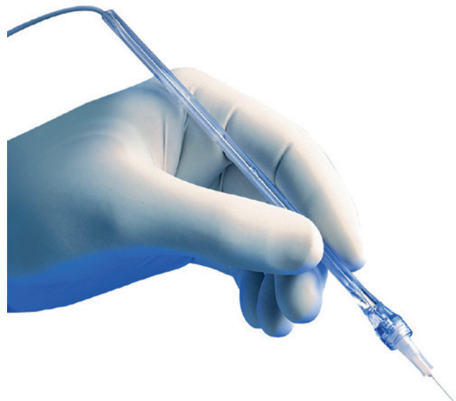
Abb. 3: Das Injektionshandstück Wand (Zauberstab) wird kaum als Spritze wahrgenommen.