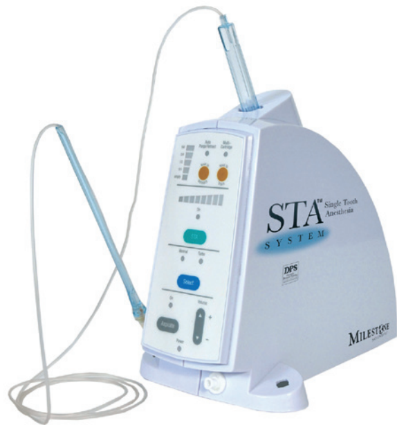
Abb. 2: Der bei der Anästhetikum-Injektion zu überwindende Gewebswiderstand kann mittels des STA-Systems präzise gemessen und der Injektionsdruck individuell angepasst werden.

Die durchgeführten Injektionen waren sicher und erfolgreich. Bei der Implantatsetzung wurde auf eine Leitungsanästhesie verzichtet. Dadurch war es möglich, durch die Beobachtung der Reaktionen des Patienten im kritischen Bereich des Nervus mandibularis, eine Verletzung des Nervs in 100% der Fälle zu vermeiden. Mittels des STA-Systems/The Wand kann man visuell die Ausbreitung des applizierten Anästhetikums im Gewebe verfolgen. Man sieht schön, wie vom Einstichgebiet fast auf Kieferkammmitte ein großes Areal anämisch wird (Abb. 5).