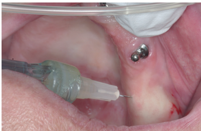
Abb. 5: Die Implantation erfolgt unter minimalinvasiver intraligamentärer Anästhesie – das Touchieren eines Nervs wird sicher vom Patienten gespürt, sodass bei Bedarf sofort reagiert werden kann.

planten Implantationen möglich ist, eine ausreichende Analgesie zu erreichen und die Belastung des Patienten signifikant zu reduzieren, wird bestätigt.